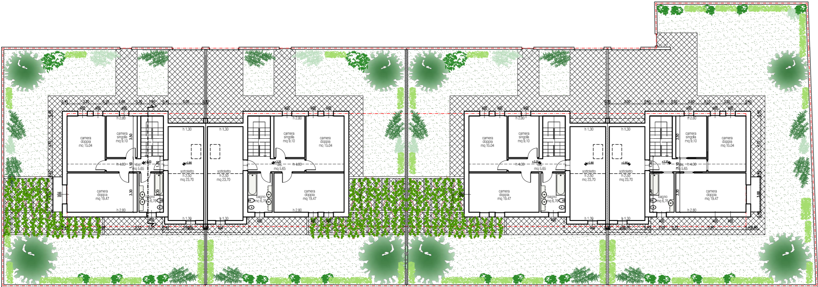
BIFAMILIARI – PIANTA PIANO PRIMO